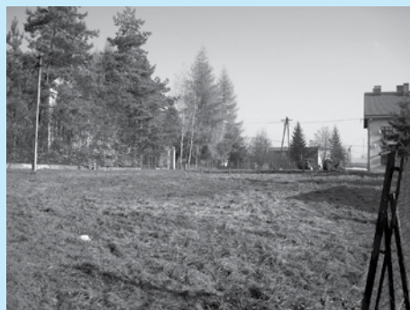
Działka przy ul. Gminnej przeznaczona na sprzedaż.

Burmistrz Miasta Cieszyna ogłasza, że w dniu 7 lipca 2014 r. w sali nr 13 Urzędu Miejskiego w Cieszynie (Rynek 1, I piętro) o godz. 10.00 odbędzie się trzeci ustny przetarg nieograniczony na sprzedaż niezabudowanej nieruchomości gruntowej położonej w Cieszynie przy ulicy Gminnej , oznaczonej jako działka nr 8/8 obr. 21 o pow. 748 m 2 , zapisana w księdze wieczystej nr BB1C/00052547/3 Sądu Rejonowego w Cieszynie.