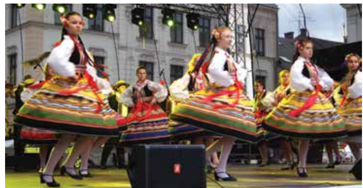
Zespół Pieśni i Tańca Ziemi Cieszyńskiej im. J. Marcinkowej na scenie.