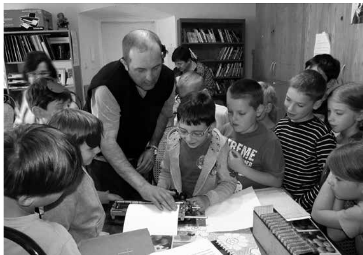
Terapeutyczny wpływ literatury, czyli warsztaty „Dotykem czytane”.