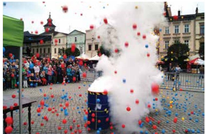
Eksperymenty Pana Korka zachwyciły dzieci.