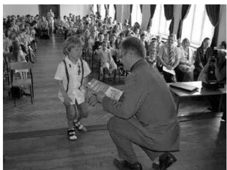
Cieszyński Uniwersytet Dzieci zakończył rok akademicki. Trwają przygotowania do kolejnego.