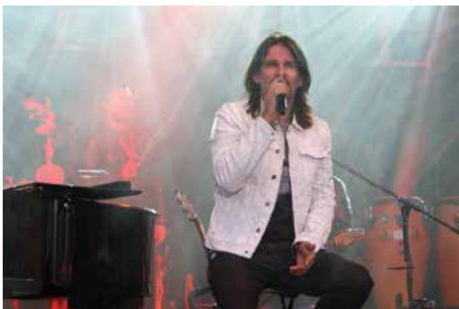
Gwiazda ŚTB, Ray Wilson, zaserwował publicznie prawdziwą muzyczną ucztę.

W niedzielny wieczór, 15 czerwca, niezwykłym koncertem Raya Wilsona zakończyło się tegoroczne Święto Trzech Braci. Charyzmatyczny artysta, jeden z najlepszych brytyjskich wokalistów rockowych, przypomniał największe hity zespołu Genesis (z którym był związany w latach 90.) oraz zagrał utwory z solowych płyt. Zabawa w Cieszynie i Czeskim Cieszynie trwała od piątku, kiedy barwne korowody spotkały się na Moście Przyjaźni przy tradycyjnym cieszyńskim strudlu, a wódarze miast symbolicznie przekazali na trzy dni klucze do połączonego wspólnym świętem miasta ludziom kultury. Na estradzie cieszyńskiego Rynku zaprezentowały się m.in.: Zespół Pieśni i Tańca Ziemi Cieszyńskiej, Miejska Orkiestra Dęta Cieszynianka, Zespół Tańca Żydowskiego „Klezmer”, kapela Tekla Klebetnica, zespół Wyremfunk.