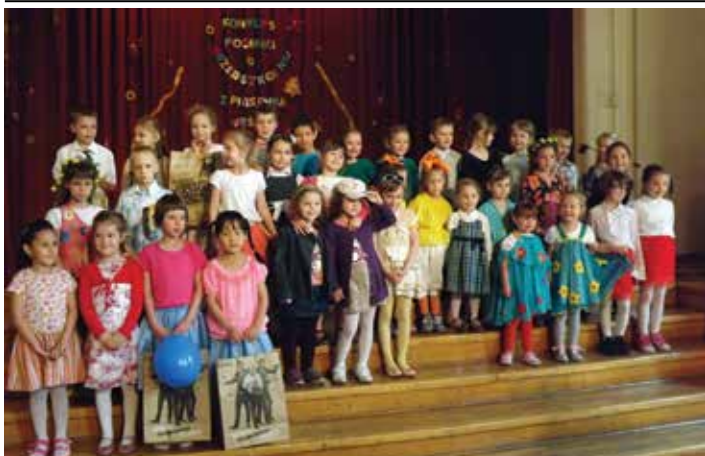
Przedsiębiorcy biorące udział w konkursie „Z piosenką weselej”.

6 czerwca w Domu Narodowym odbyła się kolejna edycja Konkursu Piosenki Przedszkolnej „Z piosenką weselej”, organizowanego przez Przedszkole nr 16 i COK „Dom Narodowy”.