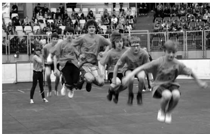
Uczniowie rywalizowali ze sobą m.in. w sprawnościowych torach przeszkód.

1. Gimnazjum nr 3, 2. Gimnazjum nr 1, 3. Gimnazjum nr 2, 4. SP z Polskim Językiem Nauczania w Czeskim Cieszynie.