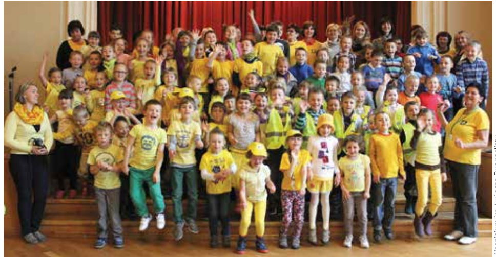
Hospicjum im. Łukasza Ewangelisty

14 maja w Cieszyńskim Ośrodku Kultury odbyło się podsumowanie tegorocznej edycji Pól Nadziei. Pomimo brzydkiej pogody sala widowiskowa zapełniła się przedszkolakami z Przedszkola nr 7 na Mnisztwie, Niepublicznego Przedszkola im. Jasia i Małgosi oraz Niepublicznego Przedszkola Twórczego To Tu, a także uczniami ze Szkoły Podstawowej nr 3 z Oddziałami Integracyjnymi. Wszystkie dzieciaki były poubierane na żółto, a więc zapomnieliśmy o deszczu, bo wśród nas było słonecznie i wesoło. Z wielką ciekawością mogliśmy obejrzeć bajkę z pro-