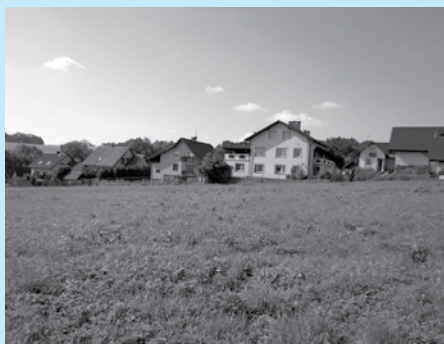
Nieruchomość w rejonie ul. Bocianiej przeznaczona na sprzedaż.

Burmistrz Miasta Cieszyna ogłasza, że w dniu 7 lipca 2014 r. w sali nr 13 Urzędu Miejskiego w Cieszynie (Rynek 1, I piętro) o godz. 10.20 odbędzie się trzeci ustny przetarg nieograniczony na sprzedaż nieruchomości gruntowej położonej w Cieszynie w rejonie ulicy Bocianiej , składającej się z działek nr 20/99 i 19/37 obr. 77 o powierzchniach odpowiednio 346 m 2 i 378 m 2 – razem 724 m 2 , zapisanych w księdze wieczystej nr BB1C/00041515/0 Sądu Rejonowego w Cieszynie.