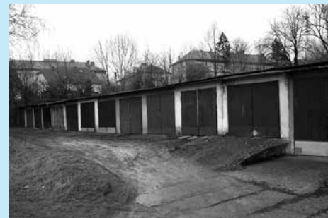
Działka zabudowana garażem przeznaczona na sprzedaż.

Dodatkowych informacji udziela Wydział Gospodarki Nieruchomościami UM w Cieszynie, tel. 33 4794 234, 33 4794 230.