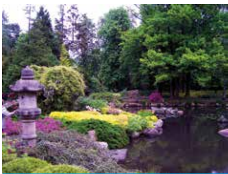
Ogród japoński we Wrocławiu.

Gdyby zrobiono ankietę na temat umiejętności korzystania z uroków życia, okazałoby się że najlepiej korzystają