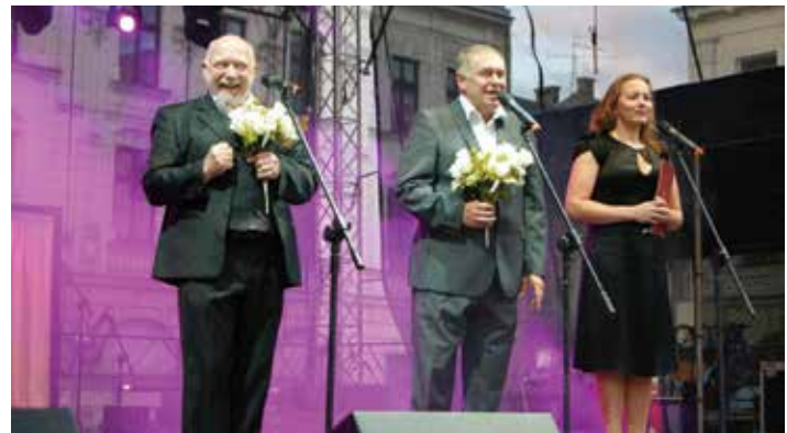
Widzów rozśmieszali mistrzowie kabaretu, m.in. Koń Polski.