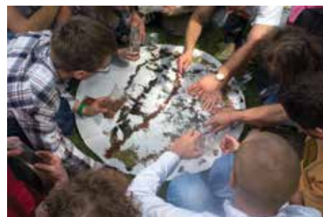
„Święto herbaty” to degustacja herbat z całego świata, a także warsztaty, koncerty i wykłady.

zna i ciepła atmosfera. Z wielką niecierpliwością czekamy na Was i na energię, którą ze sobą przyniesiecie i wypełnicie to miejsce. W pierwszy weekend lipca odkryjecie cieszyńską oazę spokoju.