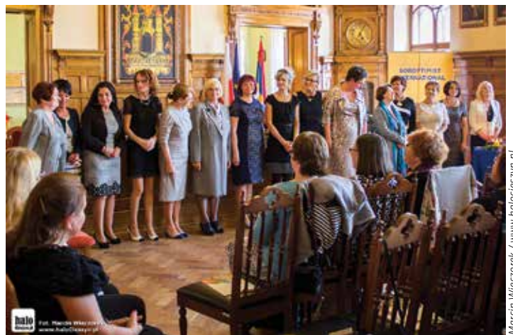
Marcin Włoczek / www.malocieszyn.pl