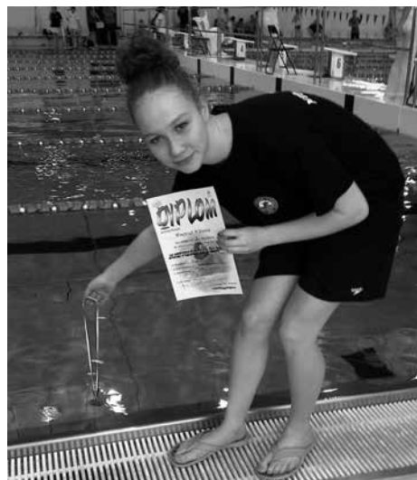
MTP „Delfin” Cieszyn”