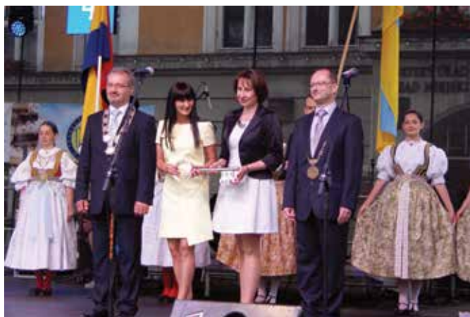
Święto zainaugurowały władze miast oraz przedstawicielki instytucji kultury.