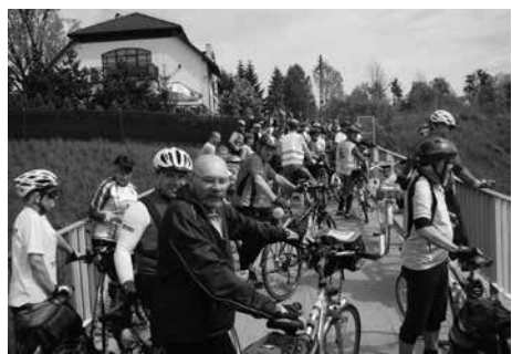
TKK PTTK „Ondraszek”

Turystyczny Klub Kolarski PTTK „Ondraszek” oraz Polskie Towarzystwo Turystyczno-Sportowe „Beskid Śląski” w Republice Czeskiej zapraszają na „Rajd do źródeł Olzy”, który odbędzie się 28 czerwca (sobota).