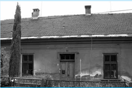
Nieruchomość przy ul. Ładnej 39 przeznaczona na sprzedaż.

Burmistrz Miasta Cieszyna ogłasza, że w dniu 23.07.2014 r. w sali nr 13 Urzędu Miejskiego w Cieszynie (Rynek 1, I piętro) o godz. 10.00 odbędzie się trzeci ustny przetarg nieograniczony