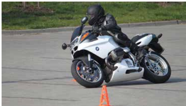
Na imprezie mile widziani są miłośnicy motocykli wraz z rodzinami.