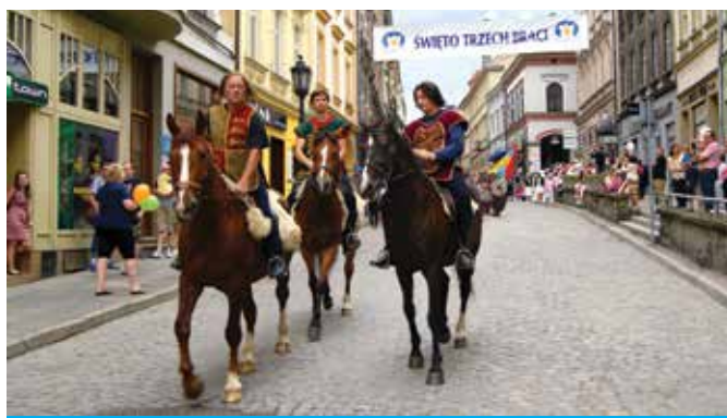
Bolko, Leszko i Cieszko, czyli bohaterowie trzydniowych uroczystości.