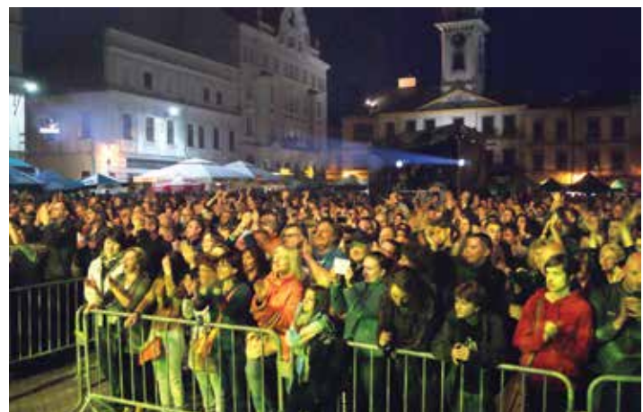
Publiczność finałowego koncertu ŚTB.