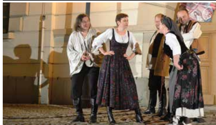
Zapowiedź spektaklu podczas Nocy Muzeów.

Scena Polska Teatru w Czeskim Cieszynie zaprasza na spektakl „Ondraszek. Pan Łysej Góry” na Wzgórzu Zamkowym. Aktorom będzie towarzyszyć Zespół Pieśni i Tańca Ziemi Cieszyńskiej. Spektakl odbędzie się 20 czerwca (piątek) o godz. 21.30 na Wzgórzu Zamkowym. Bilety: 90 Kč lub 15 zł do nabycia w: Informacji Turystycznej Zamku Cieszyn, w Teatrze Cieszyńskim w Czeskim Cieszynie lub przed spektaklem na Wzgórzu Zamkowym.